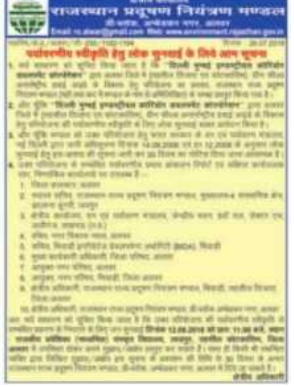
FIGURE 1.1: NOTICE TO PUBLIC HEARING

The minutes of the Public Consultation was prepared by RSPCB, Alwar and submitted to the Member Secretary, RPCB, Jaipur as enclosed at Annexure 1.1. The photographs of the Public Hearing are given at Figure 1.2. The suggestions/queries made by the various stakeholders are mentioned briefly in Table 1.1, which are incorporated in the EIA report.