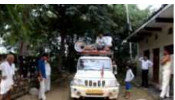
Announcement in Villages